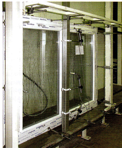
1. kép: Középen felnyíló kemény PVC ablak a vizsgáló berendezésen

A fogalom angol és német megfelelője a Watertightness és a Schlagregendichtheit kifejezés.