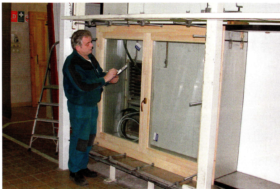
1. kép – Középen felnyíló faablak a vizsgálóberendezésen

A gyakorlati jelentőségét a légzárás értékeknek és fokozatoknak az adja, hogy egyes épülettípusok, beépítettség mértéke, szélnek való kitettség miatt eltérő elvárásokat támasztunk a nyílászárókkal szemben.